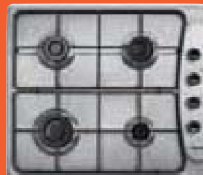
TABLE DE CUISSON Modèle PI461/6ASX 4 feux gaz avec allumage électronique, puissance totale 7500 W, sécurité gaz thermocouple, robinets gaz à réglage progressif, inox (16301) 151,99€ (dont 2€ d'éco-participation)